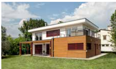
CASE NUOVE IN LEGNO SU MISURA.

Viviamo in mezzo ai boschi e conosciamo bene il dono più prezioso: il legno di Abete Bianco, elemento primario delle nostre costruzioni. Straordinario nella sua altezza, ecologico, sostenibile, naturale e profumato. La nostra centenaria esperienza ci ha insegnato a sceglierlo lavorarlo e proteggerlo per garantire al nostro cliente la miglior soluzione.