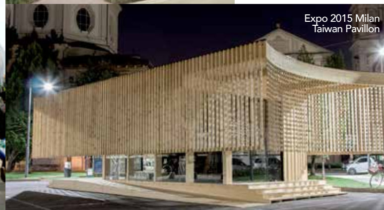
Expo 2015 Milan Taiwan Pavillon