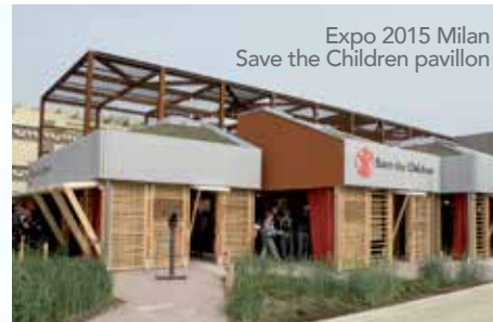
Expo 2015 Milan Save the Children pavillon