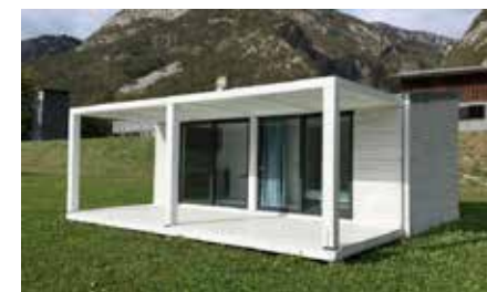
CASE TRASPORTABILI MODULI ABITATIVI PER IL TEMPO LIBERO

LegnoQUADRO Le case in legno di Design, sono la soluzione ideale per coloro che sposano uno dei progetti usciti dalla matita di architetti di fama. Progetti che portano con se indicazioni pratiche e di singolare estetica. Stili minimalisti, classici o tradizionali, proposti in diverse soluzioni.