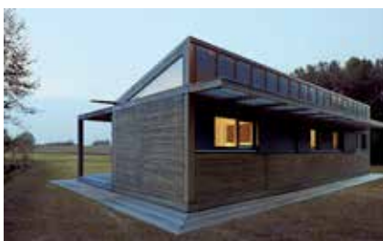
LQ LEGNOQUADRO CASE IN LEGNO DI DESIGN

Le nostre CASE SU MISURA in legno, sono il risultato della collaborazione con partner di design che condividono i nostri valori, il che significa, progettare e costruire case di legno che utilizzano pratiche innovative e responsabili. Raggiungiamo gli obiettivi dei nostri clienti, integrando nella costruzione, soluzioni innovative, naturali e di facile recuperabilità.